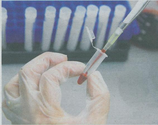
KERJA-KERJA mengambil sampel darah daripada pesakit memerlukan kemahiran dan ketelitian. - GAMBAR HIASAN